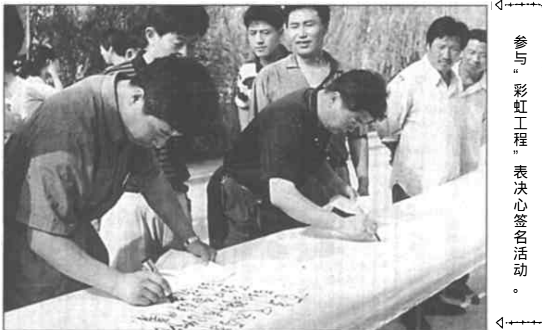
参与“彩虹工程”表决心签名活动。

在“全区文化广场巡演”活动中，这个局陆续进行了多场演出。他们编排的文艺节目，使广大观众大饱眼福，进一步展示了当代电业人高尚的精神风貌和形象。在东营区庆祝国庆50周年歌咏大赛上，该局70名干部职工参加。庞大的参赛阵容和较高的演唱水平，赢得了评委和观众的一致好评，获得了全区二等奖的好成绩。(李少棣)